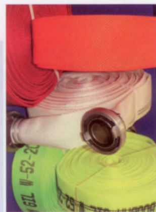
Okladka: fot. J. Kałek