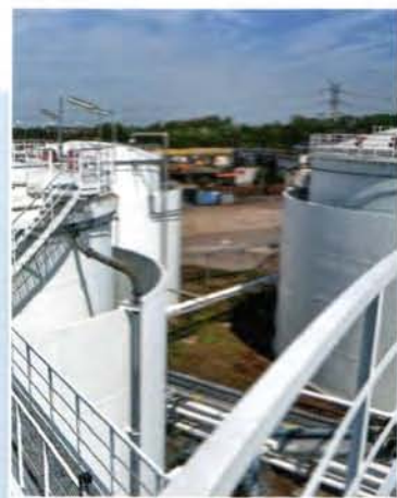
Okladka: terminal paliw TanQuid