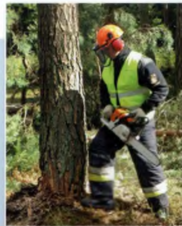
Okładka: Radosław Olkowski