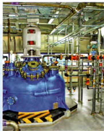
Okladka: fot. Janusz Serafin

Istota sporu sprowadzała się do rozstrzygnięcia, czy niepodporządkowanie służby bhp bezpośrednio pracodawcy lub osobie wchodzącej w skład organu zarządzającego u pracodawcy stanowi przedmiot regulacji nakazowej inspektora pracy i czy przyjęcie rozwiązań organizacyjnych w skarżącym podmiocie narusza przepisy bezpieczeństwa i higieny pracy.