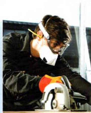
Okładka: fot. 3M Poland

20 Czas pracy w małych zakładach Pracownicy i byli pracownicy najczęściej informują inspektorów o pracy w godzinach nadliczbowych, a także w soboty i niedziele oraz o tym, że za pracę w te dni nie wypłacono im wynagrodzenia, nie udzielono innych dni wolnych za pracę w soboty i niedziele ani też godzin wolnych za pracę w godzinach nadliczbowych.