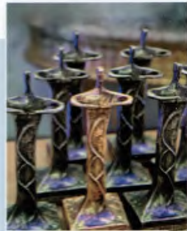
Oktadka: fot. A. Jaworski

W katalogu przestępstw w Kodeksie karnym kluczowe znaczenie z punktu widzenia działalności inspektora pracy mają te, które dotyczą naruszenia praw osób wykonujących pracę zarobkową, wiarygodności dokumentów, poświadczenia nieprawdy oraz udaremniania lub utrudniania kontroli. Są to przestępstwa ścigane z urzędu.